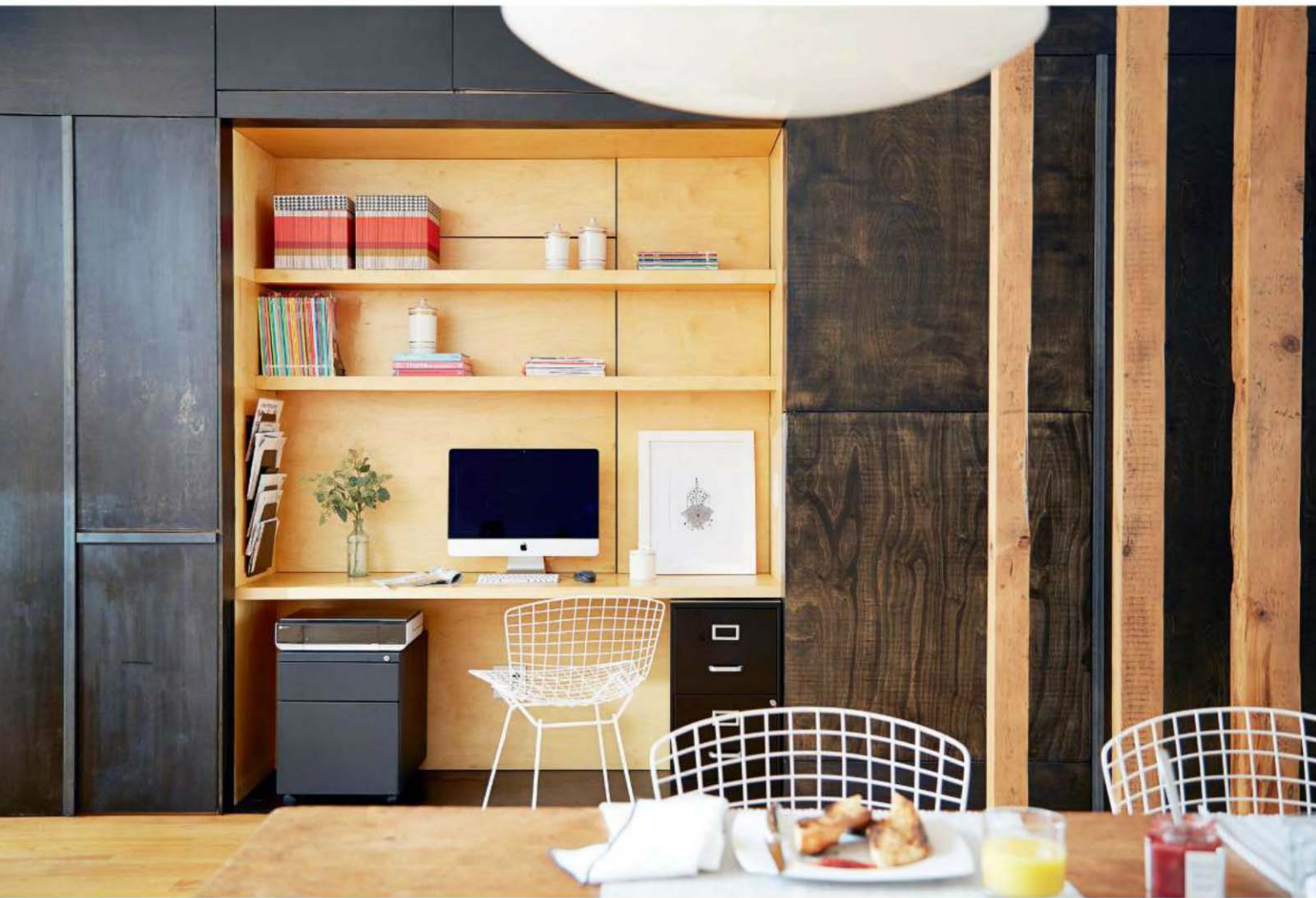
TABLE DE LA SALLE À MANGER, CHAISES BERTOIA ET SUSPENSIONS Sputnik. RÉALISATION DU BUREAU ET DES RANGEMENTS Point Carré, entrepreneur général. TOILE PERROQUET Adèle Blais, Sputnik. SERVIETTES DE TABLE, PANIER EN MÉTAL ET PLANCHE À DÉCOUPER West Elm. CLASSEURS Structube et Bureau en gros. CADRE BLANC EQ3. BOÎTE À MOTIFS Ikea.

CI-DESSUS Les deux cloisons formées de solives font place à une séparation plus légère – les planches ont été taillées en baguettes et fixées à la verticale – à mesure qu'on avance dans la maison. CI-DESSOUS L'espace bureau est encastré dans un volume noir concentrant des rangements discrets formés de panneaux de contreplaqué aux poignées profilées en acier peint.